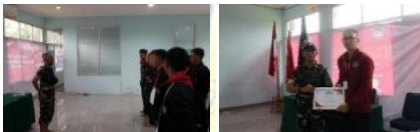
Gambar 9 Foto Suasana Kegiatan Latihan Fisik dan Penyerahan Sertifikat

Selesai memberikan pelatihan fisik kepada para peserta PPOMH 2025, di akhir sesi panitia memberikan sertifikat dan cinderamata sebagai ungkapan terimakasih atas kesediaan pelatih untuk mengisi acara kegiatan PPOMH tahun 2025.