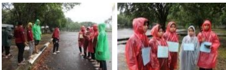
Gambar 10 Foto Suasana Kegiatan Latihan Mental

Setelah mengikuti kegiatan pelatihan fisik, para peserta PPOMH 2025 selanjutnya mengikuti kegiatan pelatihan mental yang dilaksanakan oleh panitia yang terdiri para Pengurus Himakum, kakak-kakak senior di bawah pengawasan dosen pembimbing Himakum. Dalam kegiatan pelatihan mental ini para peserta diajak mengikuti sebuah permainan yang bertujuan untuk mengasah mental para peserta untuk tidak pantang menyerah, disiplin, bertanggung jawab, dan berintegritas.