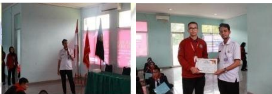
Gambar 4 Foto Pemaparan Materi dan Pemberian Sertifikat

Selesai pemaparan materi, pemateri membuka sesi tanya jawab dan diskusi. Dalam sesi tanya jawab dan diskusi ini para peserta aktif bertanya mengenai peran dan fungsi organisasi khususnya di dalam lingkungan kampus dan perlunya mahasiswa aktif dalam berorganisasi. Di akhir sesi ini, panitia memberikan sertifikat dan cinderamata sebagai ungkapan terimakasih atas kesediaan pemateri untuk mengisi acara kegiatan PPOMH tahun 2025.