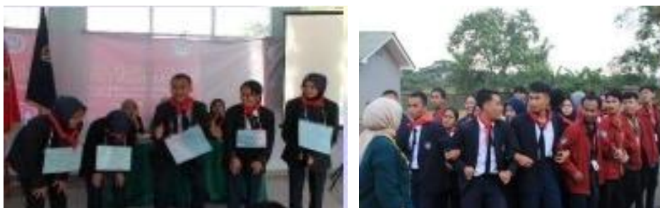
Gambar 7 Foto Suasana Kegiatan Fun Game

Selesai kegiatan pembekalan materi, para peserta PPOMH 2025 diberi kesempatan untuk istirahat. Pada sore harinya, panitia PPOMH menyelenggarakan kegiatan " Fun Game ". Fun game ini merupakan sebuah program untuk rekreasi atau entertainment guna mencairkan suasana dari rasa kebosanan para peserta. Namun demikian, fun game ini diselenggarakan oleh panitia PPOMH 2025 untuk sarana mengasah keberanian, tanggung jawab, kerja keras, dan kekompakan dalam tim. Dalam kegiatan fun game ini terlihat seluruh peserta sangat happy dan ceria.