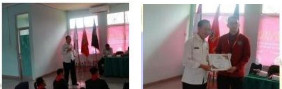
Gambar 2 Foto Pemaparan Materi dan Pemberian Sertifikat

Selesai pemaparan materi, pemateri membuka sesi tanya jawab dan diskusi. Dalam sesi tanya jawab dan diskusi ini para peserta sangat antusias menanyakan tentang konsep dan peran mahasiswa dalam bela negara. Di akhir sesi ini, panitia memberikan sertifikat dan cinderamata sebagai ungkapan terimakasih atas kesediaan pemateri untuk mengisi acara kegiatan PPOMH tahun 2025.