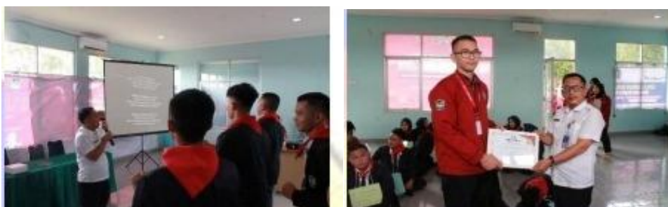
Gambar 5 Foto Pemaparan Materi dan Pemberian Sertifikat

Selesai pemaparan materi, pemateri membuka sesi tanya jawab dan diskusi. Dalam sesi tanya jawab dan diskusi ini para peserta banyak bertanya mengenai gerakan mahasiswa selaku agen perubahan bangsa dan perkembangan gerakan mahasiswa yang terjadi saat ini. Di akhir sesi ini, panitia memberikan sertifikat dan cinderamata sebagai ungkapan terimakasih atas kesediaan pemateri untuk mengisi acara kegiatan PPOMH tahun 2025.