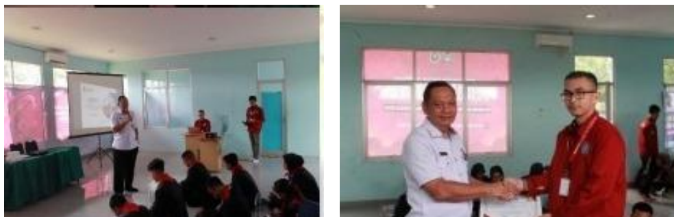
Gambar 3 Foto Pemaparan Materi dan Pemberian Sertifikat

Selesai pemaparan materi, pemateri membuka sesi tanya jawab dan diskusi. Dalam sesi tanya jawab dan diskusi ini para peserta aktif bertanya mengenai bahaya dan dampak dari 5 (lima) anti dosa di Perguruan Tinggi bila dilakukan maupun terhadap korban. Di akhir sesi ini, panitia memberikan sertifikat dan cinderamata sebagai ungkapan terimakasih atas kesediaan pemateri untuk mengisi acara kegiatan PPOMH tahun 2025.