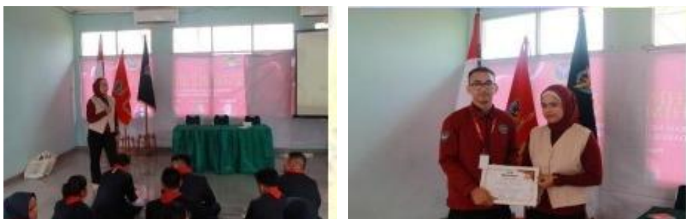
Gambar 6 Foto Pemaparan Materi dan Pemberian Sertifikat

Selesai pemaparan materi, pemateri membuka sesi tanya jawab dan diskusi. Dalam sesi tanya jawab dan diskusi ini para peserta banyak bertanya mengenai hal-hal yang perlu diperhatikan dalam pelaksanaan rapat/diskusi guna kelancaran berlangsungnya sidang/rapat organisasi tersebut. Di akhir sesi ini, panitia memberikan sertifikat dan cinderamata sebagai ungkapan terimakasih atas kesediaan pemateri untuk mengisi acara kegiatan PPOMH tahun 2025.