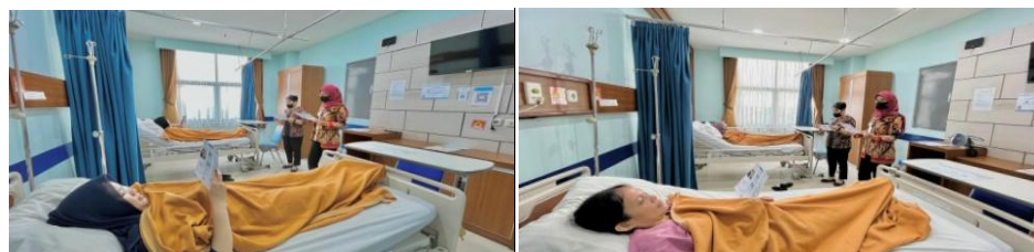
Gambar 3. Pemberian Edukasi kepada pasien

Selain itu, untuk meningkatkan pengetahuan pasien terkait gizi hipertensi pasien, dilakukan edukasi atau penyuluhan pada pasien di Rumah Sakit Yadika Pondok Bambu ditunjukkan pada Gambar 3. Edukasi adalah metode yang efektif untuk membantu pasien gizi sehat terkait penyakit hipertensi. Kegiatan ini dilakukan di enam (6) pasien rawat inap yang mengalami indikasi penyakit hipertensi, dengan tujuan pasien bisa mengkonsumsi makanan yang bergizi. Pada proses edukasi juga pasien