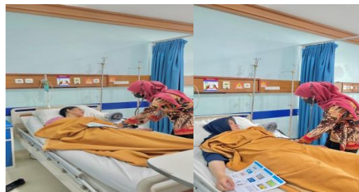
Gambar 2. Pengecekan Tekanan darah