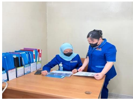
Gambar 1. Pengecekan data pasein

Kegiatan yang dilakukan untuk memastikan tekanan darah pasien meningkat dengan cara pemeriksaan tekanan darah pasien ditunjukkan pada Gambar 2. Pemeriksaan ini dilakukan dengan cermat dan teliti, menggunakan alat tensi dan stetoskop setelah itu bila hasil nya menunjukkan sistolik dan diastolic nya meningkat berarti terjadi hipertensi dan akan kita lakukan edukasi terlihat dimana dari Gambar 2. Hasil tekanan darah menunjukkan benar pasien tensi nya tinggi di lihat dari Tabel 1.